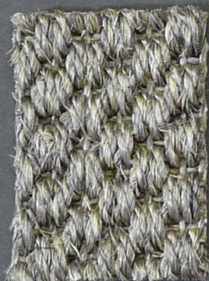
Kendo 3360 peltro