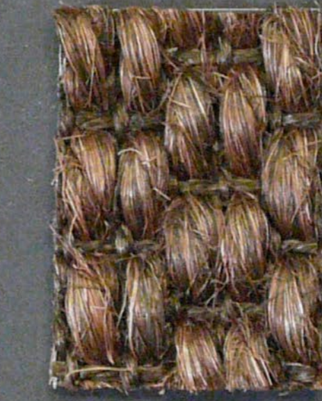
Panther 3582 bronzo