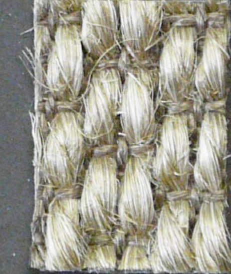
Panther 3560 peltro