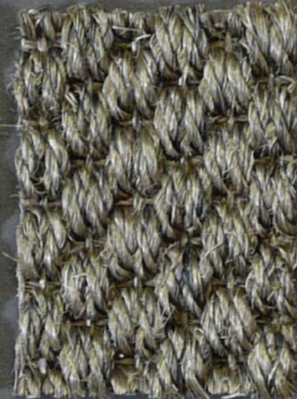
Kendo 3390 selva