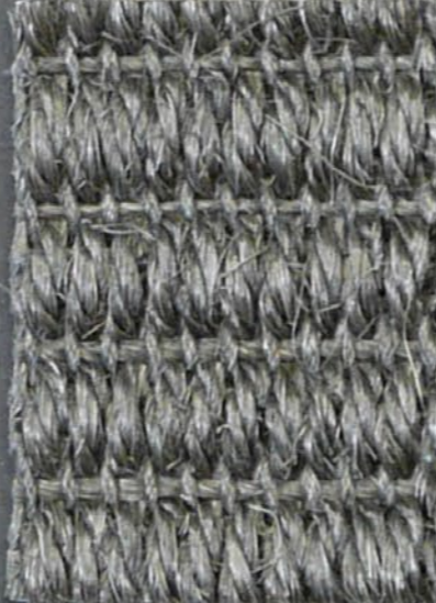
Tundra 3416 grigio