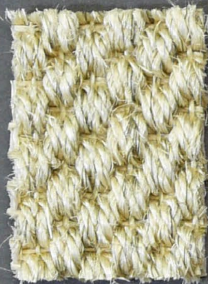
Kendo 3310 sabbia