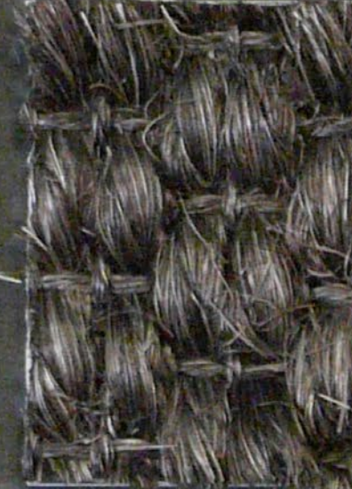
Panther 3598 piombo