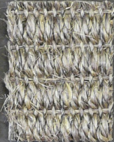
Tundra 3425 peltro