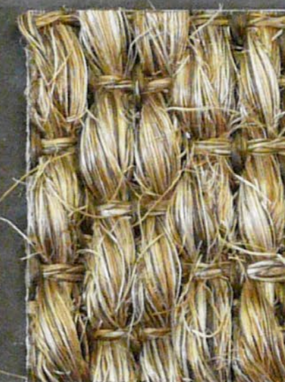
Panther 3581 nocciola