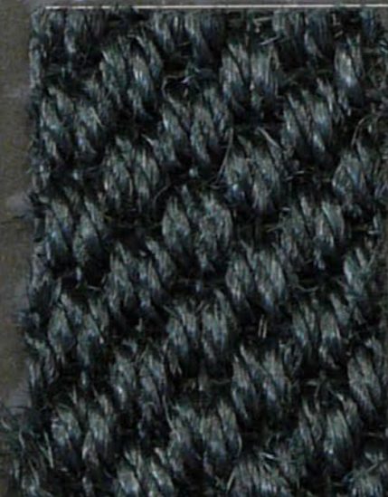
Kendo 3399 nero