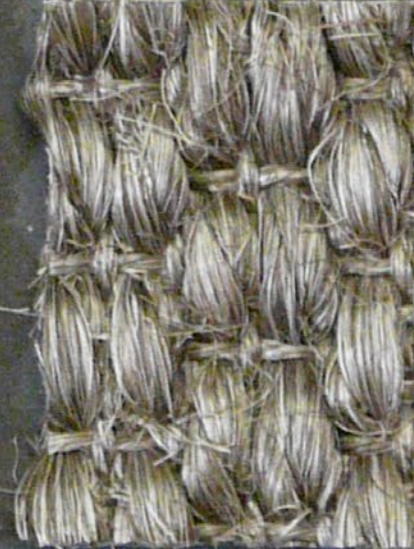
Panther 3590 tortora