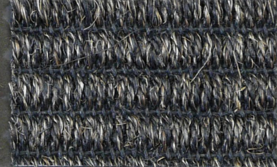
Tundra 3499 carbone