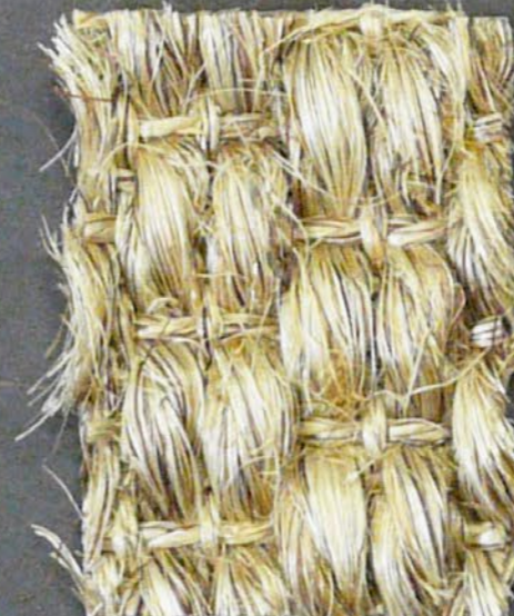
Panther 3530 miele