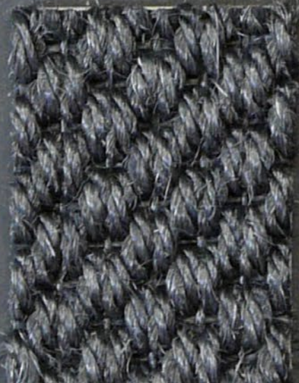
Kendo 3316 fumo