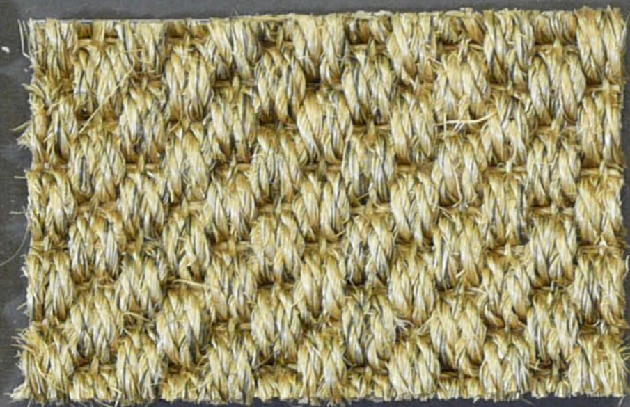
Kendo 3350 miele