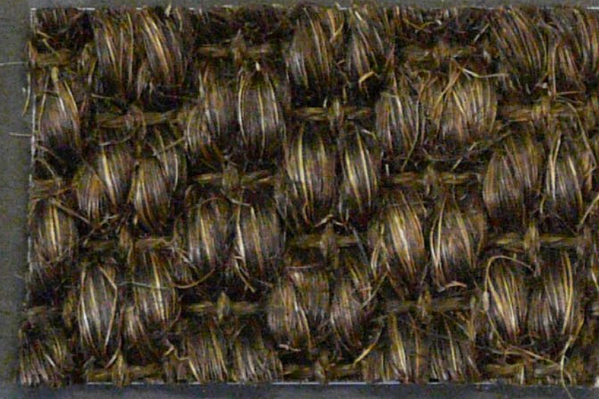
Panther 3595 moro