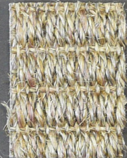
Tundra 3430 miele